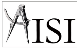
Associazione Italiana Storia Ingegneria